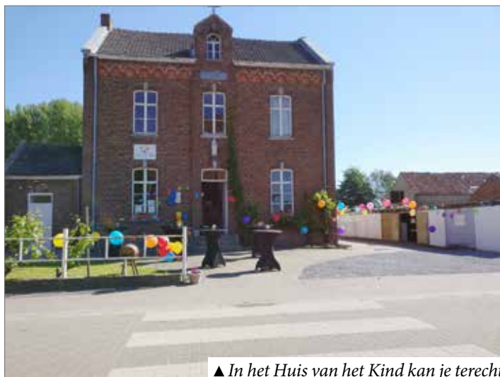
▲ In het Huis van het Kind kan je terecht voor alle nuttige info over opvoeden.

Op zaterdag 27 mei werd het Huis van het Kind Haspengouw, samen met de gloednieuwe spel-o-theek voor buitenspeelgoed, onder een stralende zon feestelijk geopend. Beide diensten zijn gevestigd in het oude schoolgebouw van Vliermaalroot op de Gauwerstraat.