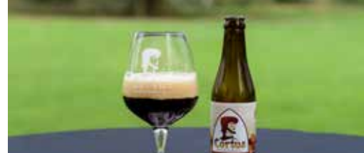
Cortus is Kortessem in een glas p.3