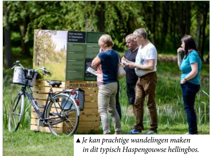
▲ Je kan prachtige wandelingen maken in dit typisch Haspengouwse hellingbos.

Op 16 juni ondertekenden het Agentschap Onroerend Erfgoed, de provincie en het Regionaal Landschap Haspengouw en Voeren (RLHV) een intentieverklaring om de Haspengouwse hoogstamboomgaarden te koesteren als waardevolle streekeigen