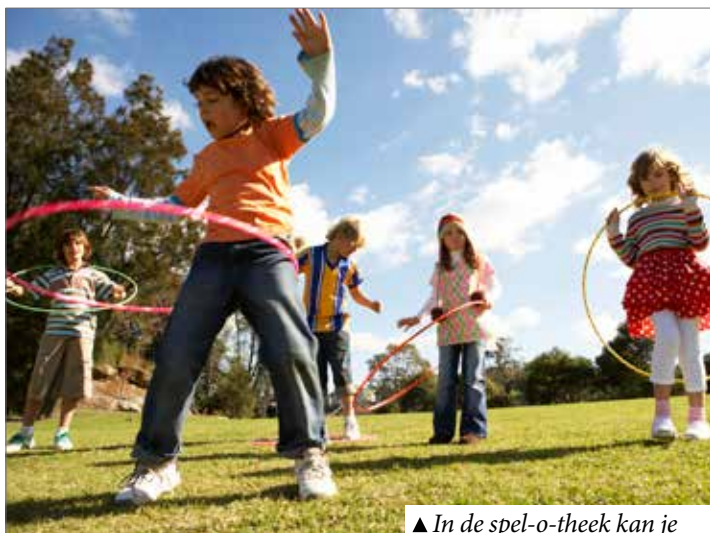
▲ In de spel-o-theek kan je ondermeer hoepels lenen.