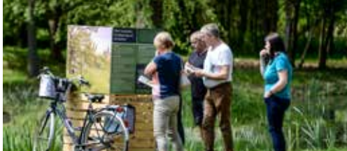
Verborgen moois in het Bellevuebos p.2