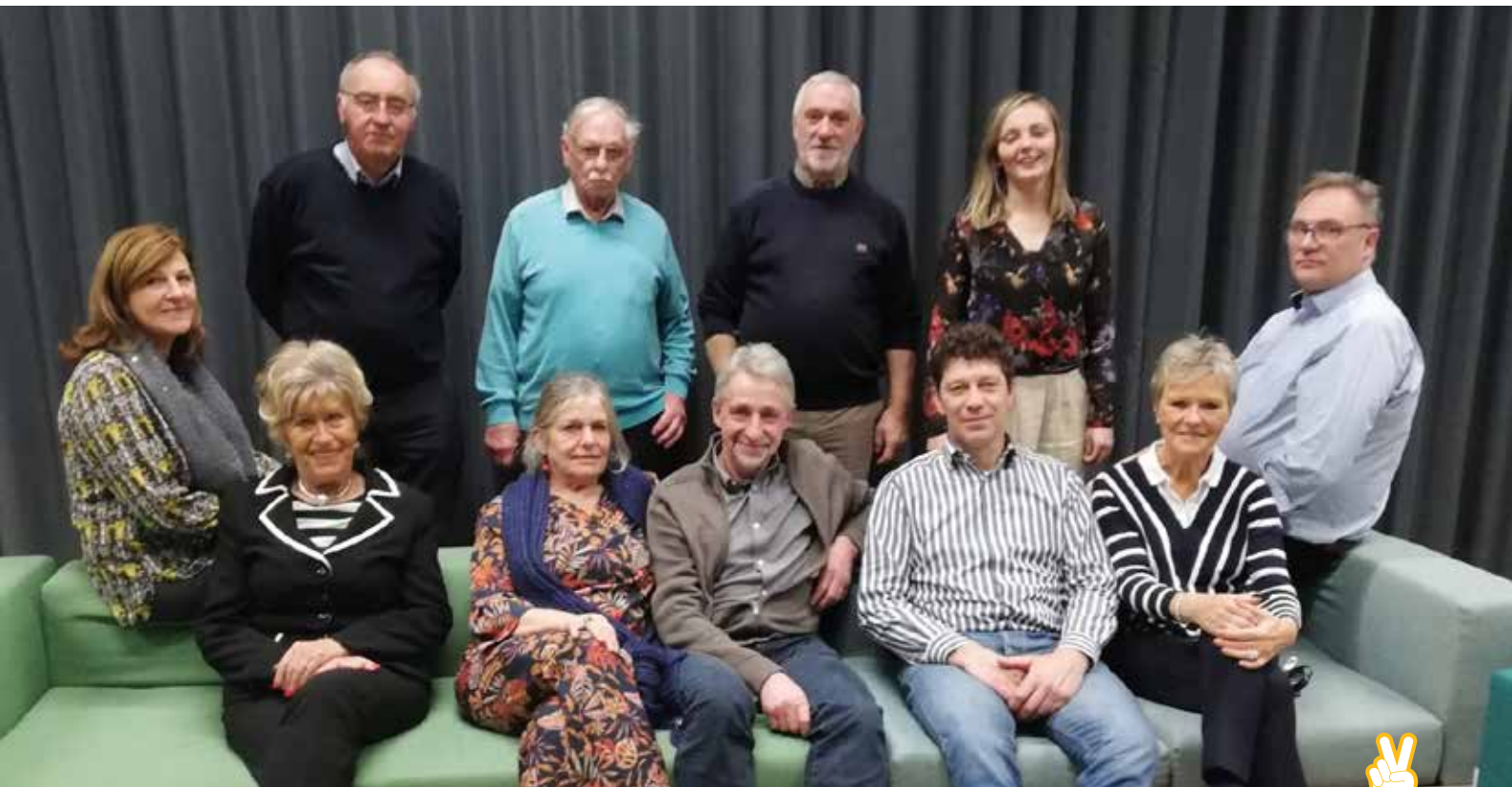
Foto genomen voor de coronamaatregelen

Vanwege het bestuur en leden van N-VA Kortessesem.