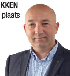
Onze financiële expert