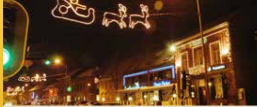
Dit jaar weer eindejaarsverlichting (p. 2)