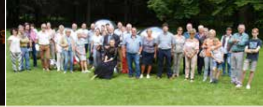
Geslaagde ledendag (p. 3)